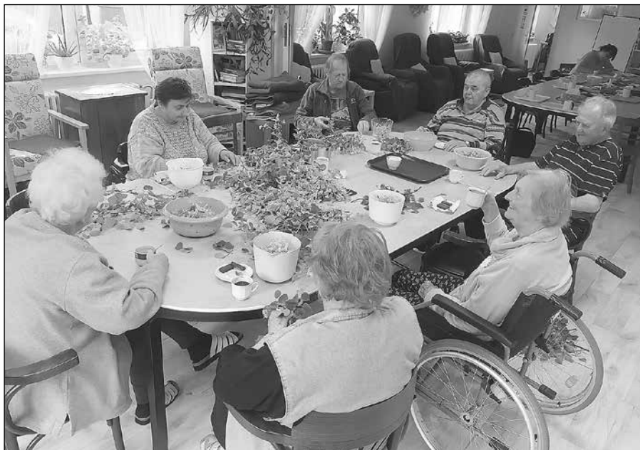
Práce s lípovým květem