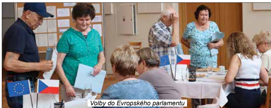
Volby do Evropského parlamentu