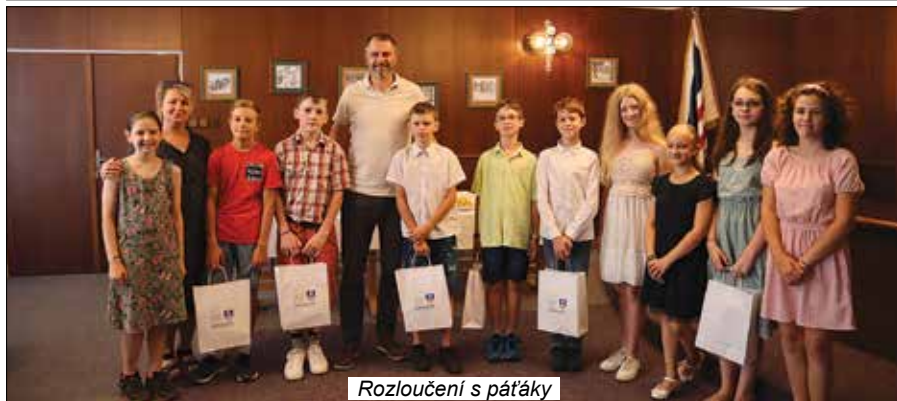
Rozloučení s pátáky