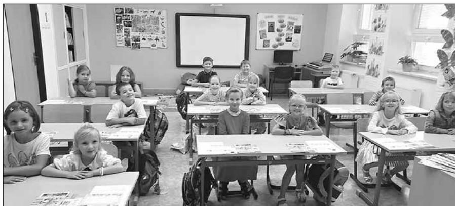
Žáci 2. ročníku