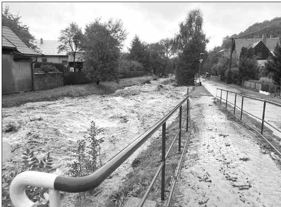
Povodeň 14. 9. 2024

Povodňová voda postupně opadala a už v neděli započaly první úklidové práce a sčítání škod. Zároveň jsme zahájili jednání s firmami, které nám pomohou s opravami poškozených mostků, s odstraňováním naplavenin a s renovací stávajících a budováním dalších protipřivalových opatření, které by měly zajistit bezpečný odtok dešťových vod z hor, přilehlých kopců a luk. Je vidět, že tato opatření jsou zásadní, víme, že tyto extrémy přibývají a budou se opakovat. To na nás klade jasný úkol