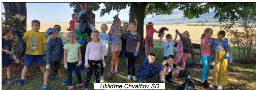
Uklidme Chvalčov ŠD