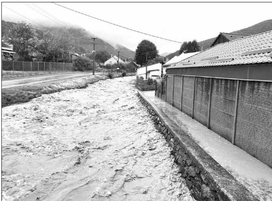
Povodeň 14. 9. 2024

v tom, abychom se zaměřili na dokončení těchto opatření a zajištění jejich průběžné údržby. Když se díváme na devastaci koryta Bystřičky, tak je nám všem smutno. Břehové hrany jsou na mnoha místech podemleté, většina stupňů (splávků) a vříšť je zničena. Intenzivní jednání s Povodím Moravy v posledních 2 letech vedlo k tomu, že Povodí získalo územní souhlas na opravu koryta v celém toku Bystřičky na území obce Chvalčova. V rámci povolení je i souhlas s kácením náletových dřevin a odtěžování sedimentu. Kácení dřevin však zastavila Inspekce životního prostředí ČR. Ve spodní části naší obce je koryto řeky nejvíce zasaženo těmito náletovými dřevinami, je zřejmé, že zásadně bránily v odtoku a způsobily vyhlížení vody z břehů. Povodí Moravy po těchto povodních okamžitě zahájilo jednání s naší obcí. Mohou nyní přistoupit k odstraňování škod a kácení dřevin v rámci protipovodňových opatření. V blízké době dojde k nejnnutnější sanaci břehových hran, odtěžování sedimentů a kácení dřevin. Bohužel projekt na renovaci splávků a břehových hran se bude muset doplnit o nové zásahy vyvolané další povodňovou destrukcí, celý projekt se tak významně prodraží. Je jen na Povodí Moravy, zda se alespoň etapově pustí do celkové rekonstrukce toku.