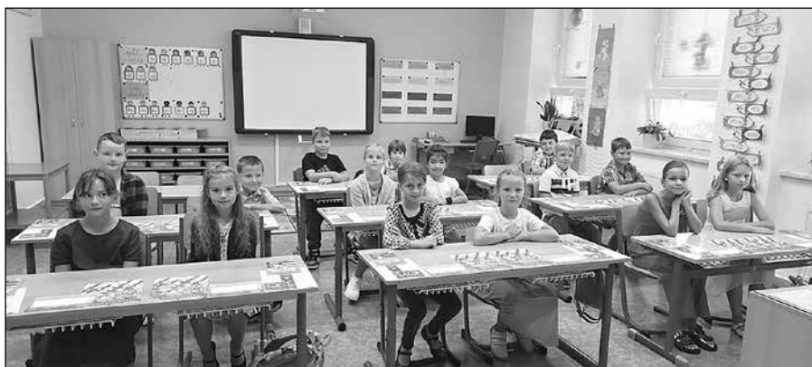
Žáci 3. ročníku