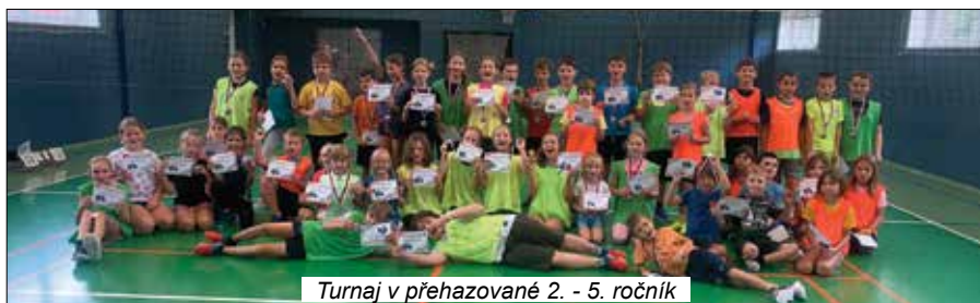
Turnaj v přehazované 2. - 5. ročník