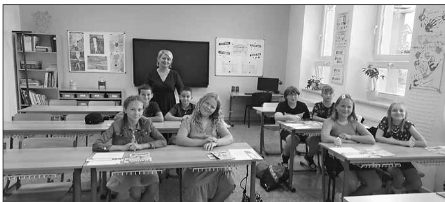
Žáci 5. ročníku