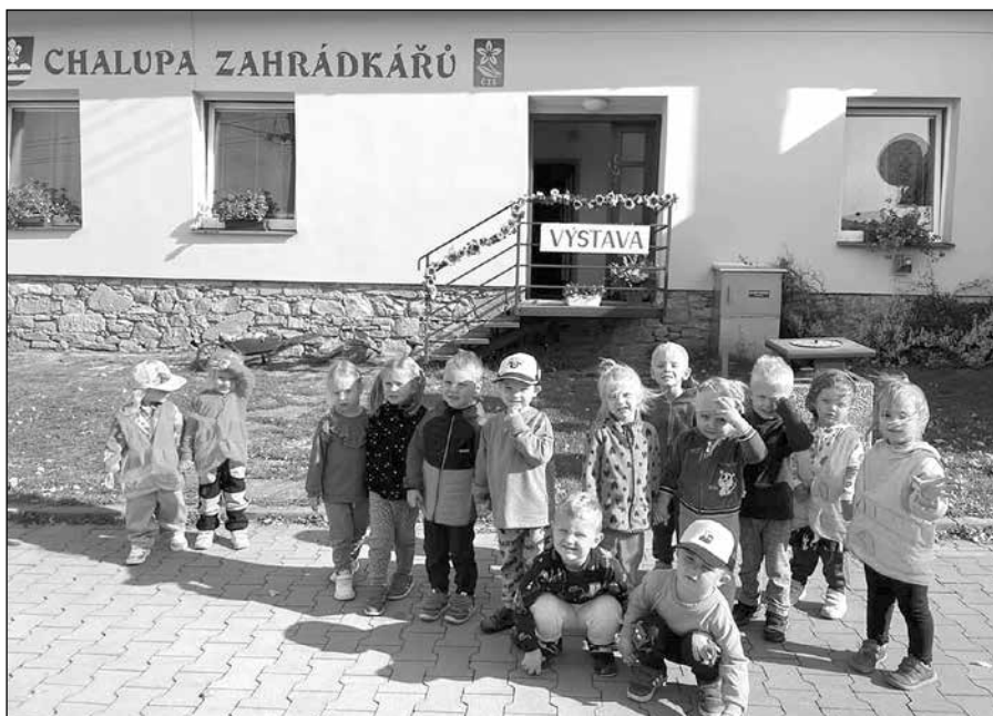
Na Chalupě zahrádkářů