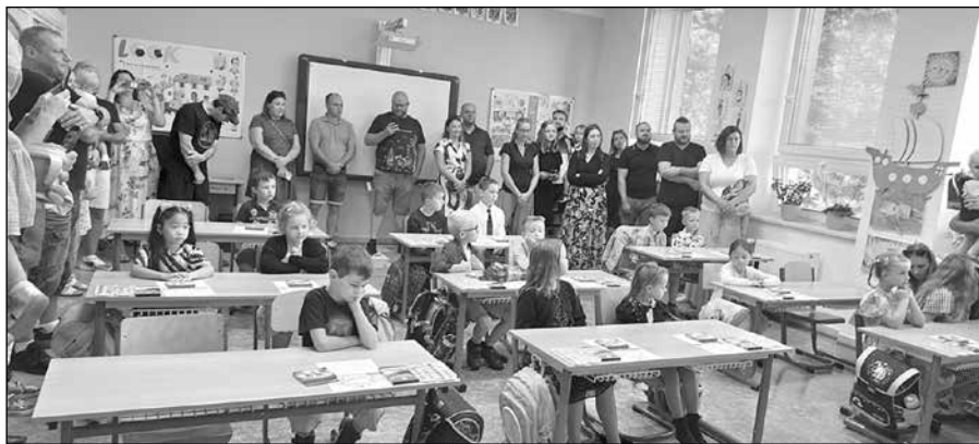
Žáci 1. ročníku

Pro letošní prvňáčky byla připravena speciální uvítací ceremonie v námořnickém stylu. Třída byla vyzdobena lodičkami, kotvami a vlaječkami, které symbolizovaly začátek nové plavby. Každý žák obdržel malou papírovou lodičku. Tento motiv je nejen symbolickým prvkem, ale i zábavným způsobem, jak děti motivovat k poznávání, objevování a překonávání výzev, kterých ve škole bude jistě dostatek.