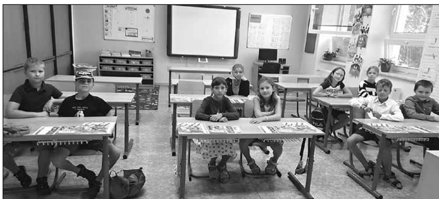
Žáci 4. ročníku