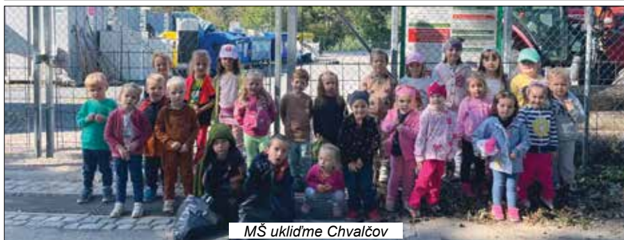
MŠ uklidme Chvalčov