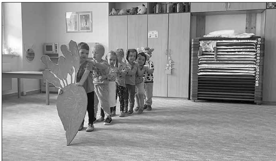
Pohádka o řepě

Program „ DIVADLO DO ŠKOLKY “ – minimálně 1x měsíčně za námi do školky „přijede pohádka“. Divadelní pohádky pomáhají dětem vžít se do různých rolí, rozvíjí fantazii a představivost, působí na city a na základní společenské vztahy a osobnost dítěte.