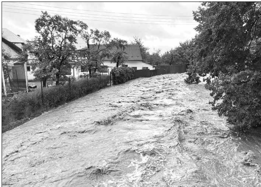
Povodeň 14. 9. 2024