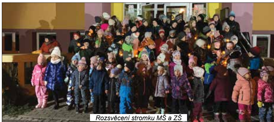
Rozsvěcení stromku MŠ a ZŠ