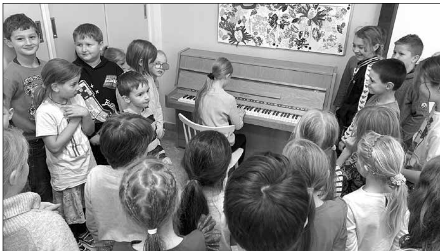
Máme nový klavír

V listopadu jsme také v naší škole zahájili program DOBRONAUTI: Hvězdný tým. Jde o dlouhodobý projekt, jehož cílem je naučit děti ustat jinakost kolem sebe, pochopit sebe i druhé, respektovat odlišnosti. Po celý školní rok budeme v třídních kolektivech podporovat dětskou všímavost a empatii ke svému okolí.