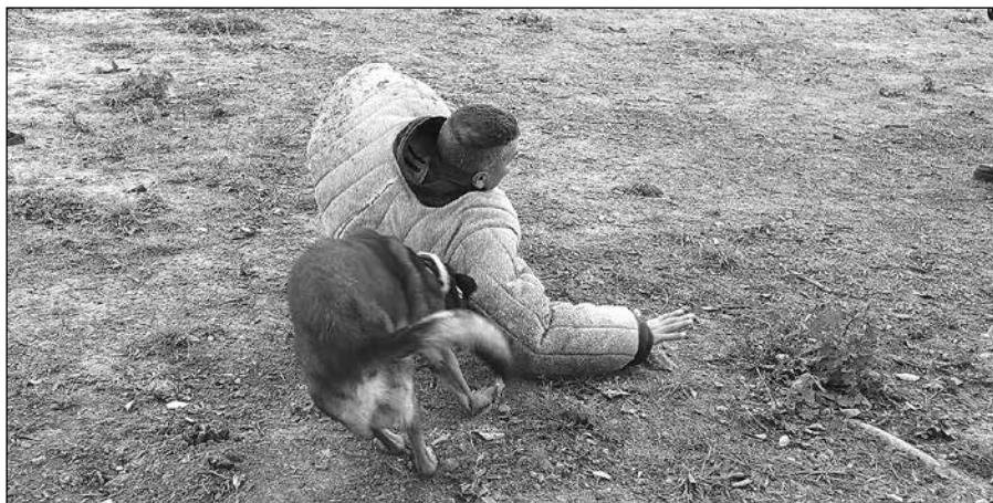
Ukázka výcviku policejního psa.

Slavnostní otevření psího hřiště proběhlo 18. října 2024 a dostavilo se na 100 pejskařů se svými mazlíčky. Specialisti na agility předvedli se svými cvičenými psy nejrůznější psí kousky, a vrcholem odpoledne byla ukázka výcviku policejního psa, nad jehož poslušností a odevzdaností páníčkovi zůstával rozum stát. Pejskaři si pro své pejsky odnesli spoustu krásných a hodnotných darů, které obci věnovala jmenovaná Purina®.