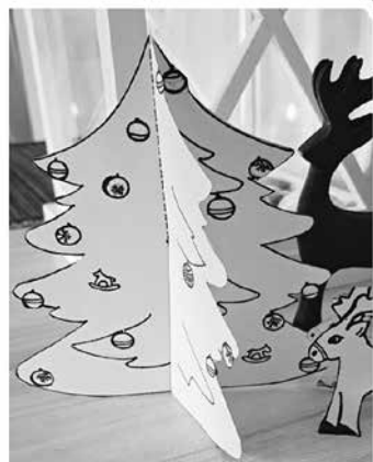
4. složený stromeček