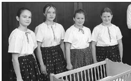
Děti pěveckého sboru

K důstojnosti slavnostního obřadu, který je vždy pro každou rodinu zvlášť, přispěl dětský pěvecký sbor pod vedením paní Aleny Sedlářové. Všem účinkujícím patří upřímné poděkování.