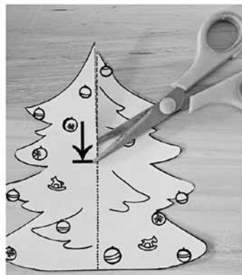
2. díl nastříhni od vrchu doprostřed