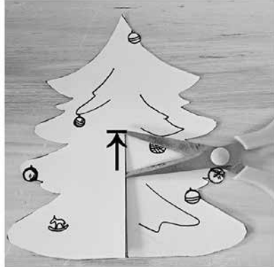
1. díl nastříhni od spodu doprostřed