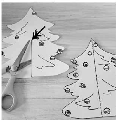
3. oba dílky slož do sebe