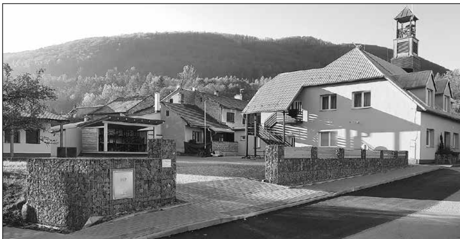
Nový chodník k č. p. 13

Stavba zázemí kulturního areálu Pod Kozincem byla vysoutěžena až v měsíci říjnu, smlouva o dílo je podepsána, realizace započne ve 2. pol. listopadu 2024, termín realizace je 8 měsíců s předpokladem dokončení akce do 30.6.2025. Zde žádáme u poskytovatele dotace IROP – program cestovní ruch o podporu, žádost se nyní vyhodnocuje. Zářijové povodně nám potvrdily, kde má obec slabá místa v rámci připravenosti na odtok přívalové vody z našich hor. V příštím roce budeme chtít komplexně zabezpečit lokalitu v Dubinách proti přívalové vodě tak, aby neohrožovala okolní nemovitosti. S těmito kroky je spojená i kompletní revitalizace tzv. mlýnského náhonu. Už letos byly provedeny v jiných částech obce výkopové práce a opravy propustků, které by měly zajistit bezpečný odtok přívalové vody. Kromě těchto investičních záměrů proběhla a probíhá celá řada oprav obecního majetku a drobných nákupů na dovybavení obecního inventáře a techniky na údržbu obce, stejně jako výkupy pozemků do majetku obce pro další stavební záměry.