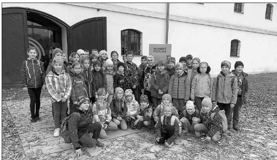
Pevnost poznání Olomouc

návštěvy byla také volná prohlídka expozice „Rozum v hrsti“. Celý program pro nás byl velkým zážitkem. Téměř všechny děti se ve svých hodnoceních těší na další návštěvu, protože opravdu nešlo stihnout všechno, co centrum nabízí.